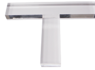
印矩アクリル製 T型 HC12

#1200 HF21 JAN 967917 各 140×230mm/2枚 ※印面をきれいにする為のペーパー。