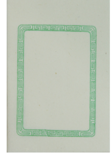
印箋 飛天 GX24