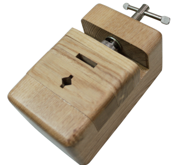
印床 ネジ式<小> HD31

HI11-5 15×15×50mm JAN 969058 入数 10本 × 10箱